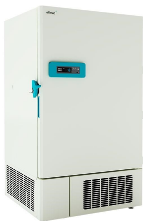
Frío para Laboratorios - Ultracongelación -40°C - Ultra congelación -40°C