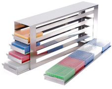
Racks deslizantes Inox