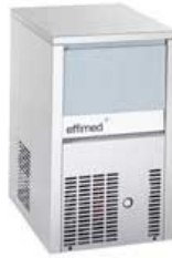
Máquina de hielo granular